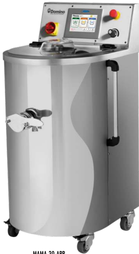
MAMA 30 APP