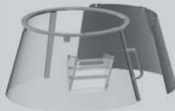
Protezione fissa/girevole in plastica "F" Fixed rotating plastic safety guard "F"